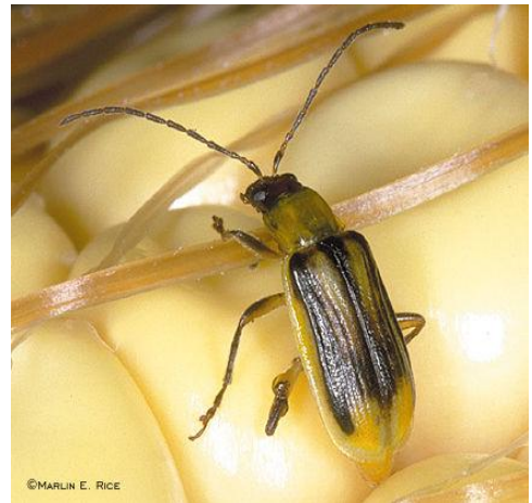
Käfer, 5 - 6 mm lang, Bild M.E.Reis

Gemäss eidg. Pflanzenschutzverordnung gilt der Maiswurzelbohrer als Quarantäneschädling. Seine Bekämpfung ist in der Schweiz obligatorisch. Die Kantone AG, LU und UR haben nach Bundesvorgaben das Vorgehen koordiniert.